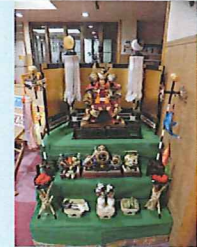
玄関に5月人形を飾りました。

今年の桜は、例年より少し早い開花となり、横河川の兩岸の桜も4月の初旬には見事に咲きそろいました。デイサービスでは、4月3日～7日まで帰りの送迎の時間を利用してお花見ドライブを行い、ご利用の皆様楽しんで頂きました。「おお～綺麗だね！連れてきてもらって本当に良かった。」との言葉も聞かれました。場所によっては桜のトンネルの中を通るようでとても綺麗でした。施設の中でも、桜の造花を飾り付け「桜のお花見風呂」を行いました。「こんな所にも桜の花が咲いているぞ！」と大変好評でした。